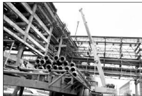
晋铝安装公司安装三队经过连续12天奋战,于7月22日提前3天贯通80万吨氧化铝循环水进140万吨老系统的管道,经试水打压合格,为整体工程完工创造了有利条件。图为在管网架上排列1500米长的循环水管。