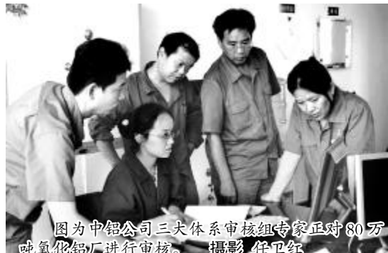
图为中铝公司三大体系审核组专家正对80万吨氧化铝厂进行审核。

★近日,氧化铝四分厂焙烧一车间对2号、3号焙烧炉换热器实施改造,将原有列管式换热器更换为板式换热器,更有利于日常检修和清洗,同时减少了用水量,大大提高换热效果。(张昕 蔡树声)