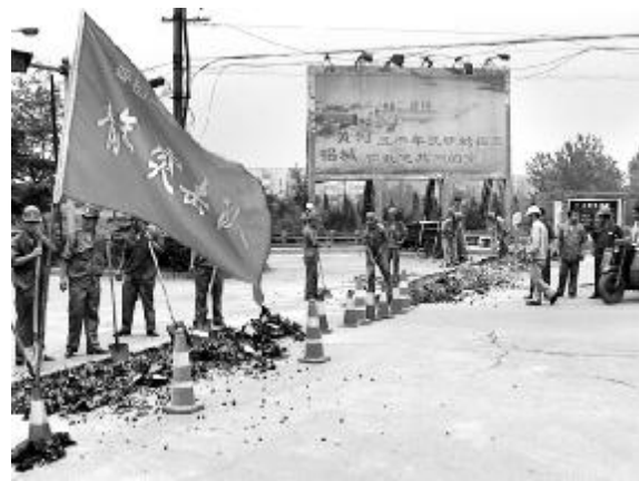
近日，晋铝建设有限公司组织80余名团员青年举行了“争做节能减排排头兵”请战仪式。请战仪式上，公司团委负责人主动向公司领导提出请战，要求奔赴于节能减排施工前线，为节能减排任务的全面完成贡献团员青年的一份力量。图为团员青年在进行义务劳动。

★近日，晋铝民生服务中心组织领导班子、各单位及科室负责人认真学习了《中共中央纪委关于严格禁止利用职务上的便利谋取不正当利益的若干规定》和厂纪委相关文件精神，促进中心廉洁从业、廉洁经营工作的深入开展。