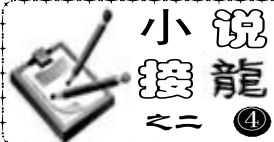
小说接龙 之二 ④