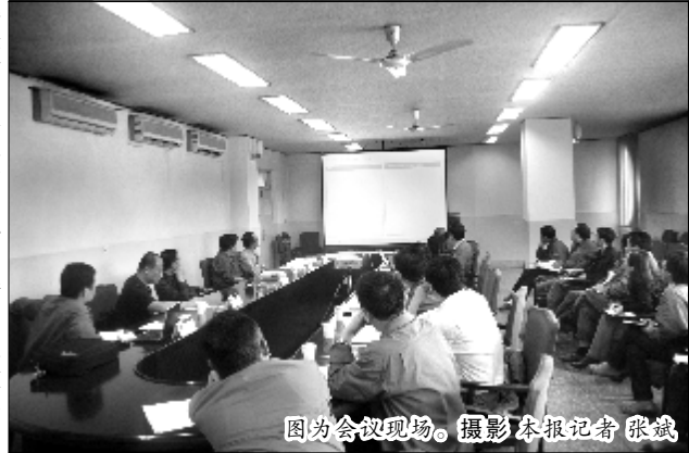
图为会议现场。

冷正旭强调,要深入贯彻落实熊维平总经理提出的“领导重视是关键,广泛参与是基础,科学方法是根本,深化改革是动力,专业化团队是保障”的要求,大胆创新、努力工作,力争形成山西企业的管理文化、管理品牌。