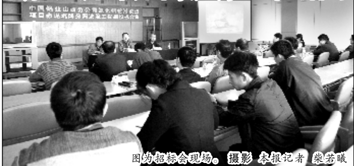
图为招标会现场。摄影 本报记者 柴若曦

评标组本着公开、公平、公正的原则,对参与投标的三家单位的资质进行了核验,对各投标文件的密封情况进行检查,最后中色十二冶金建设有限公司中标。