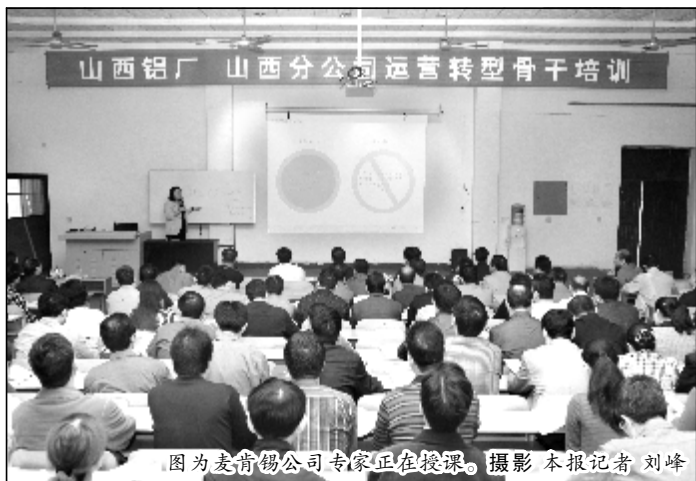
图为麦肯锡公司专家正在授课。摄影 本报记者 刘峰

本报讯(记者曹小刚)9月14日上午,山西铝厂、山西分公司第一期运营转型骨干培训班在培训中心开班。山西铝厂厂长、山西分公司总经理冷正旭,山西分公司副总经理裴卫东、张占明,山西铝厂党委副书记、纪委书记、工会主席韩俊科,中铝总部运营转型办公室成员李兆刚、李德杰及企业第一期培训班学员共同参加了运营转型基本知识的培训学习。