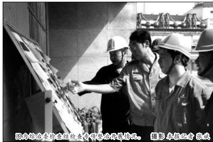
图为综治委检查组检查专项整治开展情况。