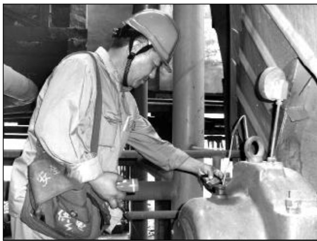
动值。摄影报道 张瑞 础。图为点检员正在测量锅炉引风机轴承箱的振动设备的运行状况,为锅炉安全稳定运行奠定基础。点检,设备管理人员每周五集体巡检,全面掌握转动设备的安全稳定运行,车间组织每天两次精密间严抓操作工按时巡检,热电分厂锅炉车

同时分厂通过下发“三室”管理样板标准并对各车间进行现场指导,车间每天对照自查表进行自查,两级联动检查的形式督促车间积极整改。目前,热电分厂“三室”管理水平得到大幅提升,为进一步规范员工行为、改善工作环境和养成良好职业习惯创造良好条件。(杨红 陈文都)