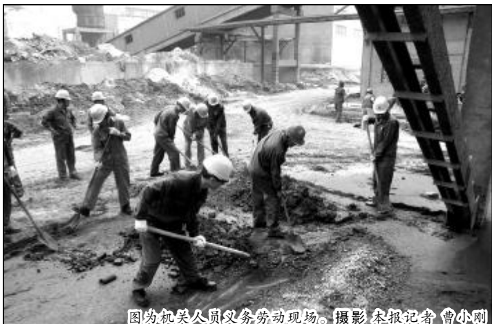
图为机关人员义务劳动现场。