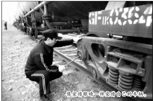
像爱惜眼睛一样爱惜自己的车辆。

2010年9月份，运输部党委确定了“支部在实践成果上创先进、党员在岗位行动上争优秀”的创先争优活动定位，在此基础上为进一步发挥共产党员先锋模范作用，将创先争优