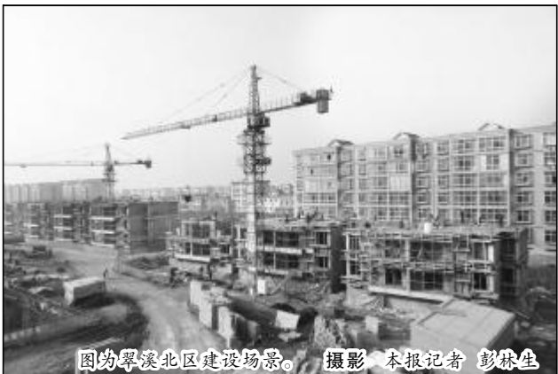
图为翠溪北区建设场景。

科技化工公司始建于 2003 年 6 月,现有职工 236 名。公司成立以来,在“励精图治 创新求强”企业精神的指引下,牢牢树立“靠科技追求卓越 以诚信赢得市场”的管理理念,恪守“锁定一流,惟新是举,以人为本、自主发展”的核心价值观,不断改革创新,优化工艺,历经艰苦创业、稳产提产、科技兴企三个发展阶段。公司规模不断壮大,综合竞争力不断提升,形成了工艺先进,拥有自主知识产权,市场信誉度高,年产拟薄水铝石 15000 吨、活性硅铝粉 4500 吨的催化剂生产企业,产品远销甘肃、湖南、四川等地,并出口丹麦、伊朗。