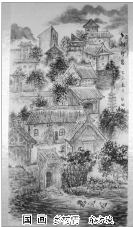
国画 乡村情 东方城