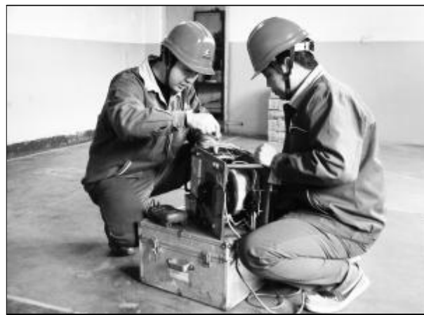
水电分厂电气检修车间积极开展修旧利废,工作之余员工们通过实践,刻苦钻研设备故障修理技术,既节约了设备维修费,又增强了员工对各种设备的熟悉程度,同时调动了员工学技术的积极性。图为员工正在认真钻研故障设备的维修技术。摄影报道 王冬梅 李新玲