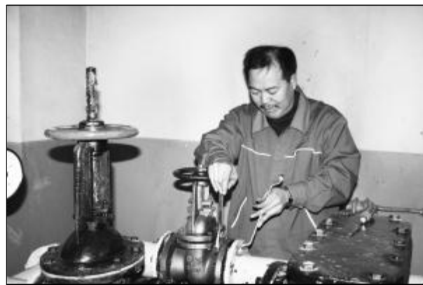
为确保冬季煤气使用安全,西旺物业部民用煤气车间加强了对煤气调压器设备的巡检,利用供气低峰期消除设备隐患,确保辖区的正常供气,维护居民的正常生活秩序。图为检修人员正在更换调压器阀门。