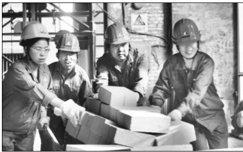
7月11日检修分厂组织领导班子成员和机关人员在氧化铝二分厂6号回转窑搬运耐火材料，当天共完成近80吨的耐火砖、水泥等搬运工作，加快了6号回转窑的砌筑进度。