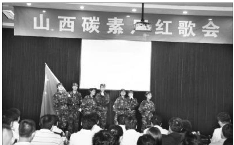
为丰富广大职工业余文化生活,7月10日,由山西碳素厂工会和党委工作部共同举办的红歌演唱会在新落成的多功能会议厅举行,共有17位职工报名参加比赛。比赛现场气氛热烈,参赛选手尽情地展示自己的歌喉,亲友团及观众不时地为选手送上鲜花助兴,并和着节奏拍手鼓励。图为晋铝物流有限公司职工演唱《打靶归来》。

编者:五个多小时的蹲坑守候,换来的虽然仅仅是两编织袋焦炭,但更重要的是他们那种以厂为家,尽职尽责的精神。