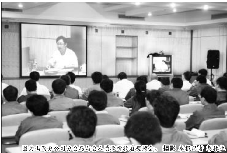
图为山西分公司分会会场与会人员收听收看视频会。

敖宏要求中铝公司各部门各单位要紧密结合下半年各项工作,进一步抓好整改落实,切实解决突出问题;巩固和发展学习实践活动成果;扎实做好群众满意度测评和“回头看”工作;结合整改落实继续做好控亏增盈工作,确保学习实践科学发展观活动真正成为群众满意的工程,为公司“再造竞争新优势,科学发展上水平”做贡献。