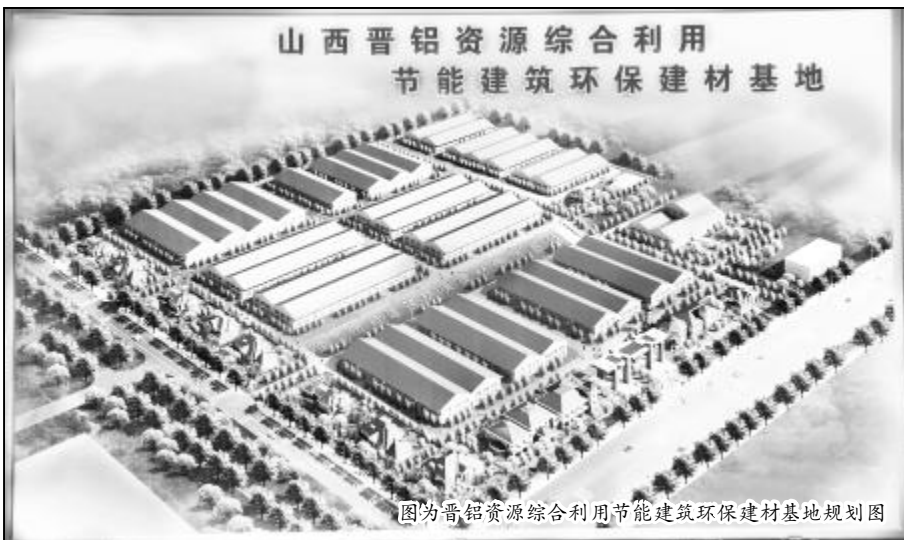
图为晋铝资源综合利用节能建筑环保建材基地规划图

为在一至两年内建成全国节能建筑环保建材产业基地,目前,相关单位正在加紧示范基地中的展厅、大门、综合办公楼等项目的建设,建筑装修材料将采用山西晋铝华丽建筑科技开发有限公司生产的轻型钢结构 ASA 板镶嵌式集成节能抗震建筑体系和“森第”牌新型系列环保建材产品,项目将于 7 月底建成。