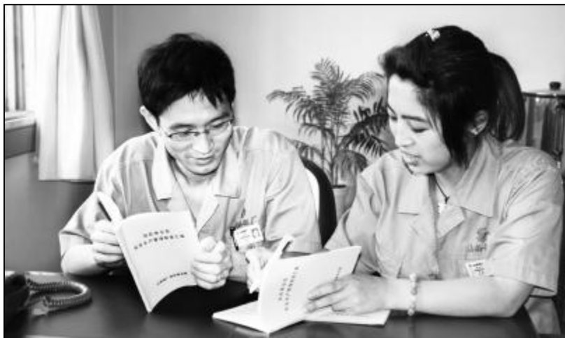
6月是安全活动月,西旺物业部紧紧围绕活动主题,重新修订、完善了《西旺物业部安全生产规章制度汇编》一书,下发给一线员工。图为西旺员工自发学习《西旺物业部安全生产规章制度汇编》。

开展人工卸车竞赛活动,分厂干部员工极大地增强了凝聚力和战斗力,提高了主人翁意识,为企业打赢控亏增盈攻坚战,高质量恢复生产奠定了基础。(裴秀花)