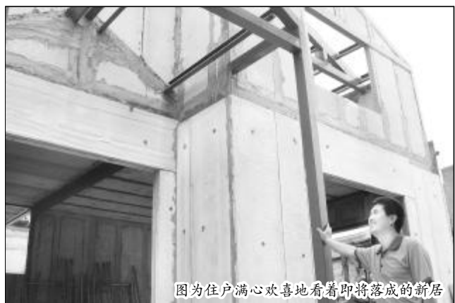
图为住户满心欢喜地看着即将落成的新居