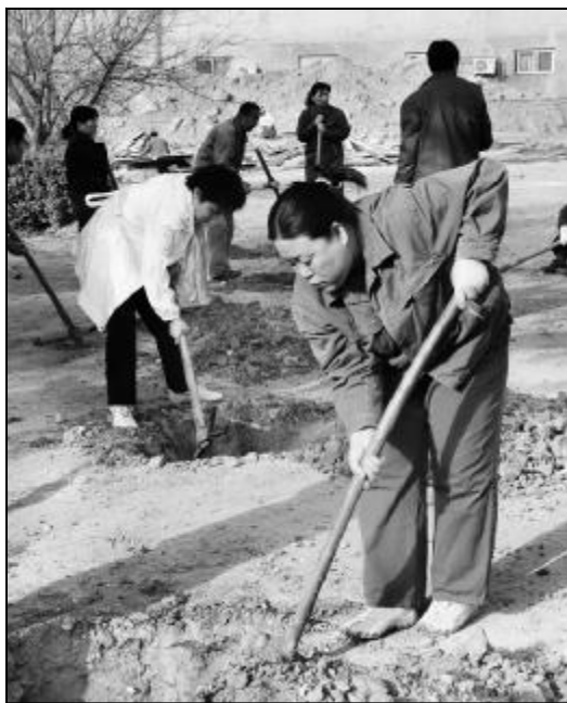
3月22日、25日上午,职工医院组织职能科室全体人员到新建住院楼前进行义务植树。此次活动的开展,将进一步美化医院环境,增强大家的环保意识。摄影报道 姚丽丽 范军枝

本报讯 3月21日,检修分厂员工常俊民喜获“全国有色金属行业劳动模范”荣誉称号,在北京京西宾馆参加了表彰大会,并受到党和国家领导人接见。